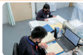
文書データ化作業