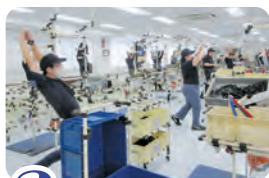
2 始業前の準備体操